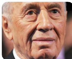
(Shimón Peres, 2012)

"El Estado de Israel será medido por la influencia que tenga sobre la pobreza y el analfabetismo en el mundo... Llegará un día y este será el juicio de la empresa sionista"