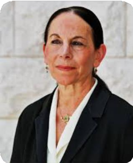
Ex juez israelí de la Corte Suprema de Israel