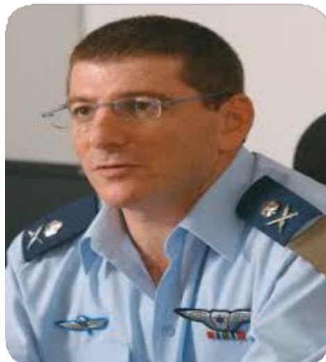
El excomandante de la Fuerza Aérea de Israel, mayor general (retirado)