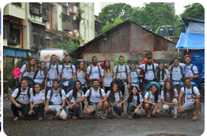
Jóvenes de Israel junto a jóvenes de la comunidad judía de Guatemala en un viaje de voluntariado conjunto. Ciudad de Guatemala